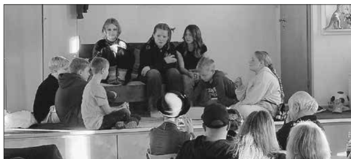
Die Freunde beraten, wie sie ein Wochenende ohne Smartphone überstehen können.

Wir bedanken uns herzlich bei allen Besucherinnen und Besuchern sowie bei den vielen engagierten Helferinnen und Helfern, die zum Gelingen dieses schönen Nachmittags beigetragen haben!