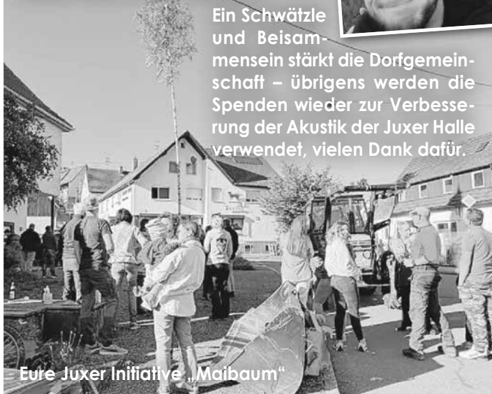
Eure Juxer Initiative „Maibaum“